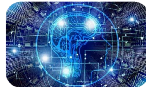
データに基づく意思決定

DXは、既存のビジネスモデルを見直し、新たなビジネス機会を探求するための手段となります。デジタル技術の進歩により、従来では考えられなかった市場や顧客層への進出が可能となります。例えば、サブスクリプションモデルやプラットフォームビジネスが注目されています。