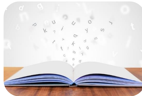
新たなビジネスモデルの創造

DXは、顧客との接点やサービス提供方法を変革する機会を提供します。デジタルチャネルを活用したパーソナライズされた体験や、便利で迅速なサービス提供が可能となります。顧客のニーズに応えるために、オムニチャネル戦略やデジタルマーケティングが重要な要素となります。