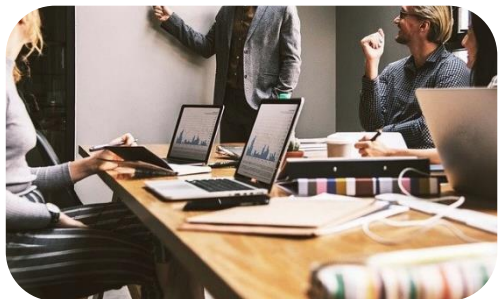
効率化と生産性の向上

デジタル技術を活用することで、業務プロセスの自動化や効率化が可能となります。例えば、人工知能やロボティクスを導入することで、繰り返しのタスクを自動化し、人材をより戦略的な業務に注力させることができます。